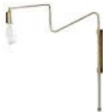
Applique murale 236€ orientable - Lightonline