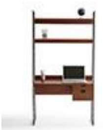
Bureau étagère - La 410€ Redoute