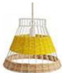
Lampe Suspension 170€ Straw - La Redoute