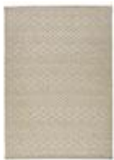
Tapis Tapetto - La50€ Redoute