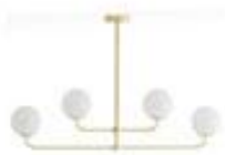
Suspension 4 globes opaline - La Redoute