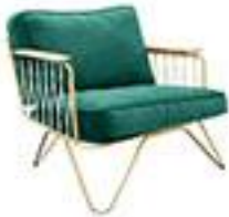
Fauteuil Croisette Smallable -685€