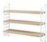
Etagère String Pocket -130€ Smallable