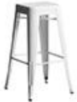
Duo de tabouret de bar -500€ AMPM