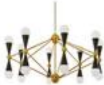
Suspension Caracas -2700€ Made in Design