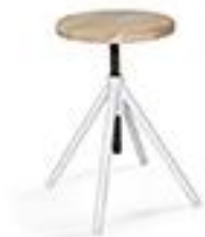
Tabouret à vis métal et76€ bois - La Redoute