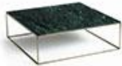
Table basse effet laiton 850€ vieilli/marbre - AMPM