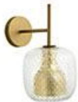
Applique en laiton -100€ AMPM