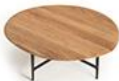
Table basse chêne - AMPM