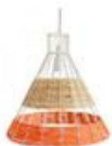
Lampe Suspension 190€ Straw - La Redoute