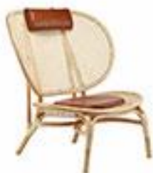
Fauteuil en bambou - The Cool Republic