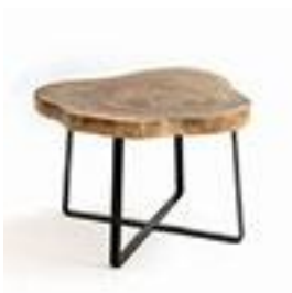
Bout de canapé bois - AMPM