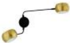
Applique double métal90€ noir et laiton - La Redoute