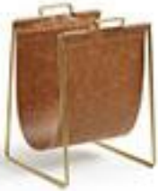
Porte-revues - La50€ Redoute