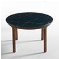
Table basse plateau290€ marbre - La Redoute