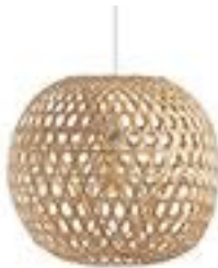
Suspension boule75€ bambou - La Redoute