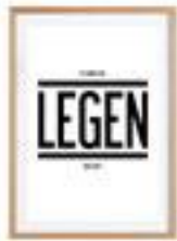
Affiche sous cadre en 40€ bois - Junique