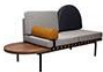
Canapé Grid Petite3200€ Friture - Made in Design