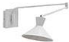
Applique Voltige - AMPM 149€