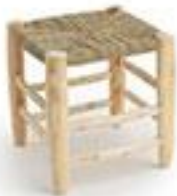
Tabouret style marocain -40€ La Redoute