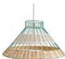
Lampe Suspension 200€ Straw - La Redoute