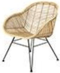
Fauteuil en rotin -200€ Maisons du Monde