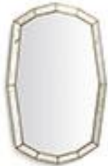
Miroir - La Redoute 160€