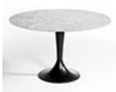
Plateau de table marbre - AMPM 750€