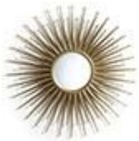
Miroir soleil - AMPM 180€