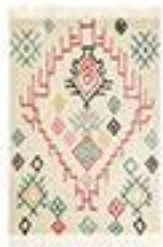
Tapis style berbère en laine - La Redoute 200€