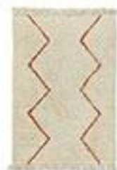
Tapis style berbère en laine - AMPM