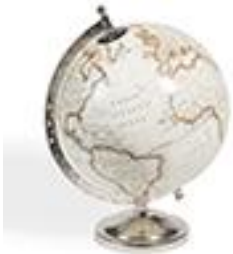
Globe terrestre - Maisons du Monde