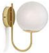
Applique opaline - La65€ Redoute