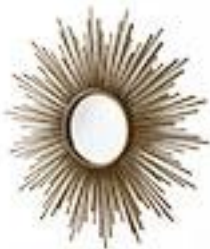
Miroir soleil - AMPM 160€