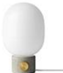
Lampe à poser Béton -180€ Lightoline