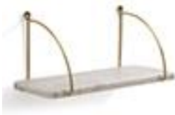
Etagère murale en50€ marbre - La Redoute