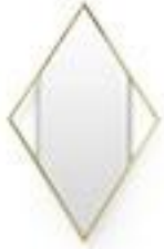
Miroir losange en laiton -80€ La Redoute