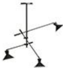
Suspension 3 bras 210€ articulés - AMPM