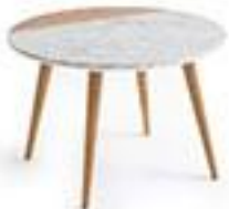
Table basse plateau marbre - La Redoute 170€