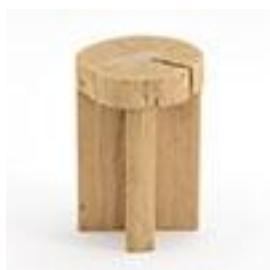
Bout de canapé chêne 140€ massif - La Redoute