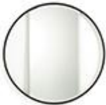
Miroir rond - La Redoute 70€