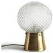
Lampe à poser verre et laiton - La Redoute