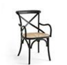
Fauteuil dos croisé - La Redoute 130€