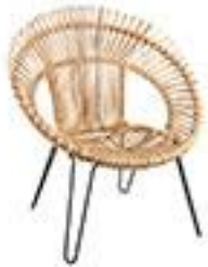
Fauteuil en rotin naturel et métal - La Redoute 220€