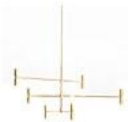
Suspension dot atomium 1890€ - The Conran Shop