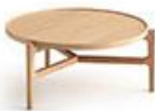
Table basse en chêne - AMPM 300€