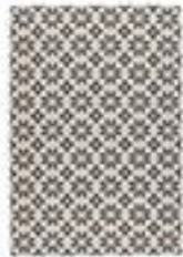
Tapis carreaux de ciment 46€ - La Redoute