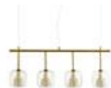
Suspension ligne globes - AMPM