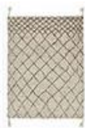
Tapis style berbère en300€ laine - AMPM