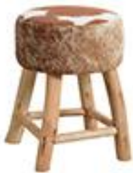
Tabouret en peau de 100€ vache - La Redoute