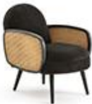
Fauteuil velours et 335€ cannage - La Redoute