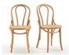
Duo de chaises style bistrot - La Redoute 220€